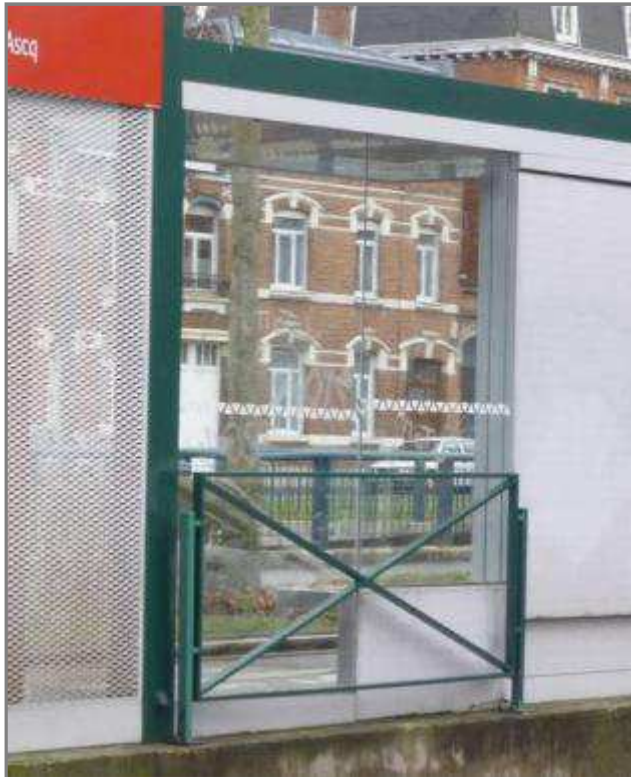
Conforme en exploitation

Commentaires : Il est notamment admis quelques traces.