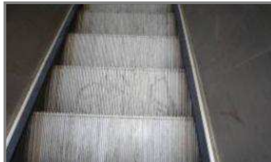
Conforme en exploitation