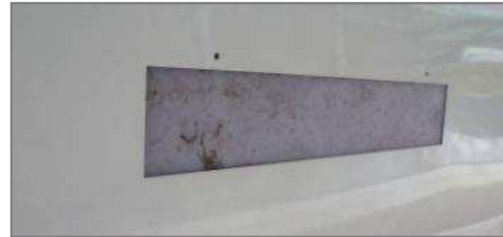
Non Conforme en exploitation

Commentaires : Par exemple, Encrassement important, présence de nids à poussière, de tags ou d'autocollants.