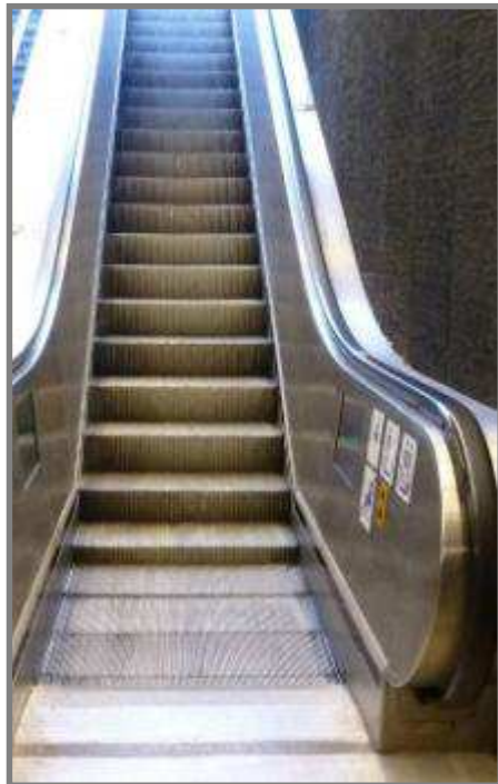
Conforme en début d'exploitation