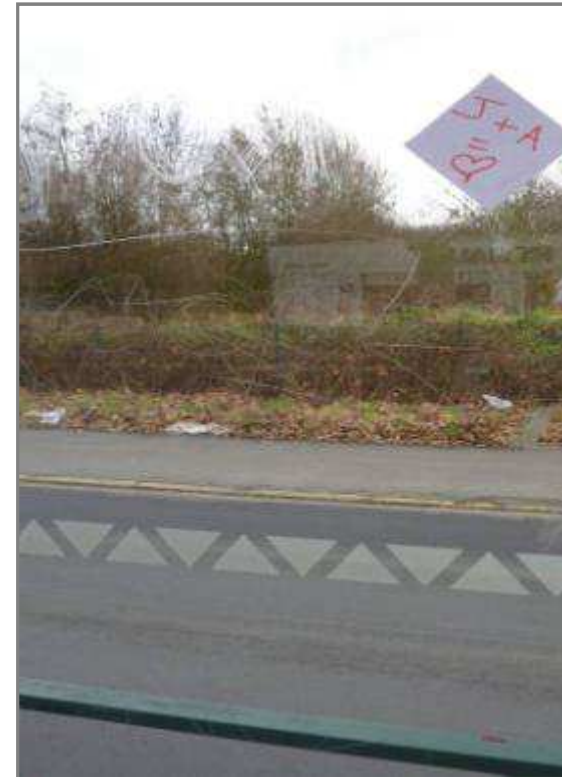
Non Conforme en exploitation

Commentaires : Par exemple, Encrassement important, présence importante de tags ou d'autocollants.