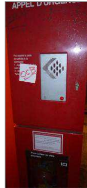
Non Conforme en exploitation

Commentaires : Par exemple, Encrassement important, présence de nids à poussière, de tags ou d'autocollants.