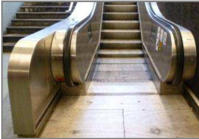
Conforme en exploitation